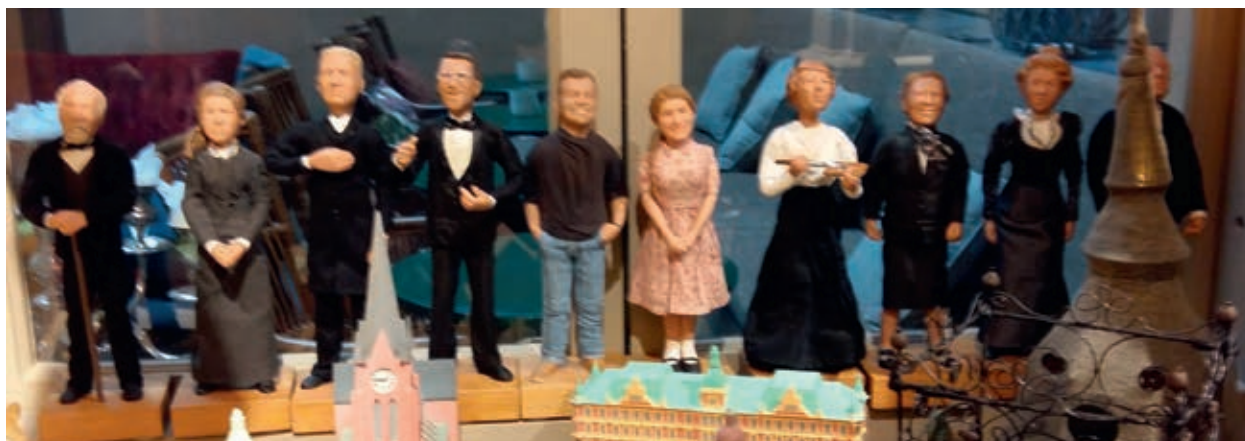
"Kändisbordet" med tillhörande personer och byggnader från Sundsvalls spännande historia fram till idag.