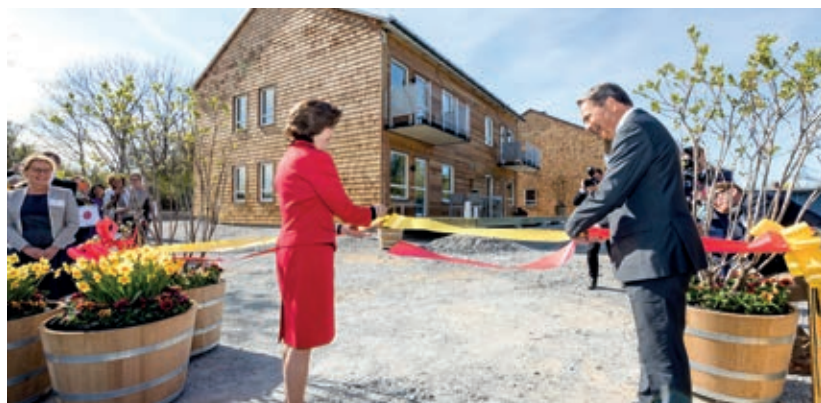
Invigning av SilviaBo i maj 2017. Drottning Silvia och Claes Dinkelspiel klipper banden.

"Köp Rosenkorten! Eller skicka in bidrag direkt till projektet. Bankgiro konto 446-4996, ange projektets namn."