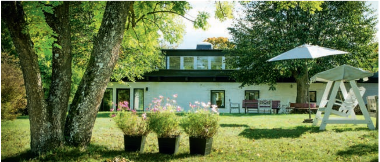
Silviahemmet, som ligger vackert beläget i närheten av Drottningholms slott, används för dagvård och utbildning.