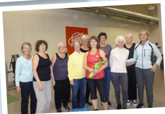
Hela gänget i Skara IWC på gymmet