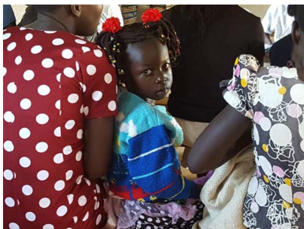
En liten flicka väntar på att få komma in till doktorn