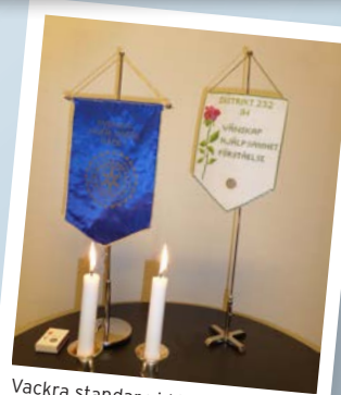
Vackra standar vid RM i Sollefteå