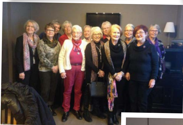
IW-dagsfirare i Vänersborg