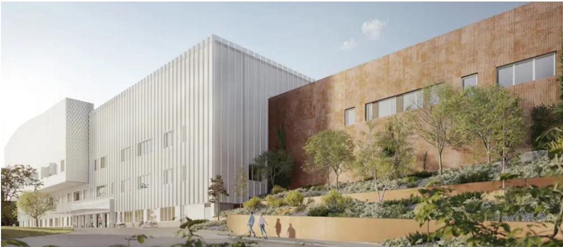
Visionsbild av vårdbyggnad och servicebyggnad